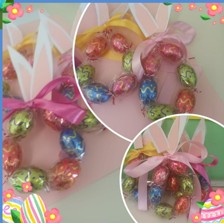
Coniglietti con cioccolatini